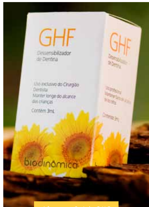
1 frasco con 3mL de G.H.F.

después de la aplicación y el paciente no tiene restricciones para ingerir alimentos líquidos o sólidos. No necesita ser fotocurado y no forma una película sobre la superficie dental. Compatible con cualquier sistema adhesivo o restaurador, pudiendo ser usado como “primer” en los sistemas restauradores o cementantes que necesitan de este agente. El Flúor presente en su composición es un agente adicional en la desensibilización de la dentina.