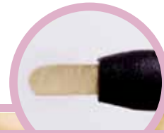
consistencia del BIOPLIC

trabajo rápido y seguro. Mejor estética: presentado en solo un color - similar al color del diente. Cómodo: por tratarse de un procedimiento rápido y sin necesidad de uso de las fresas. Sellado: Después de aplicado el material tiene una leve expansión haciendo un perfecto sellado marginal. Esta propiedad ocurre porque BIOPLIC tiene una hidratación muy pequeña a través de la absorción de la saliva, promoviendo una presión en las paredes de la cavidad proporcionando un sellado total. Compatible con restauraciones de resinas - no contiene Eugenol. No es necesario acondicionamiento ácido antes de su aplicación.