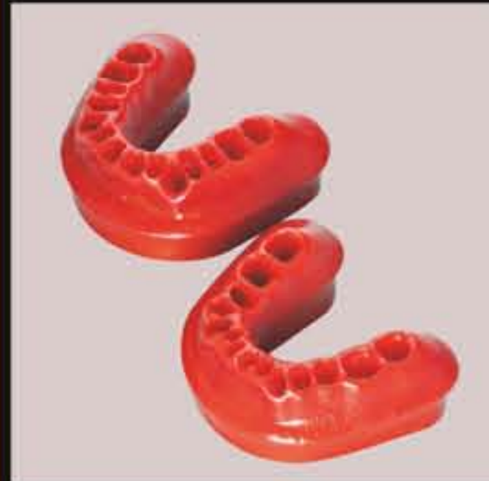
DT.1401.01 Class I Pair / Paio Classe I DT.1401.02 Class II Division I Pair / Paio Classe II Divisione I DT.1401.03 Class II Division II Pair / Paio Classe II Divisione II DT.1401.04 Class III Pair / Paio Classe III