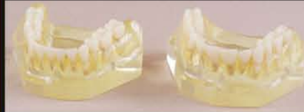
DT.1315.01 Teeth without roots Denti senza radici DT.1315.02 Teeth with roots Denti con radici