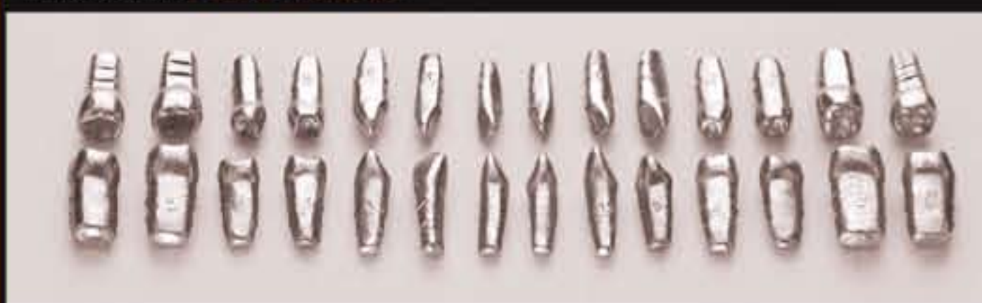
DT.1403.01 Set of 28 teeth without roots / Set di 28 denti senza radici