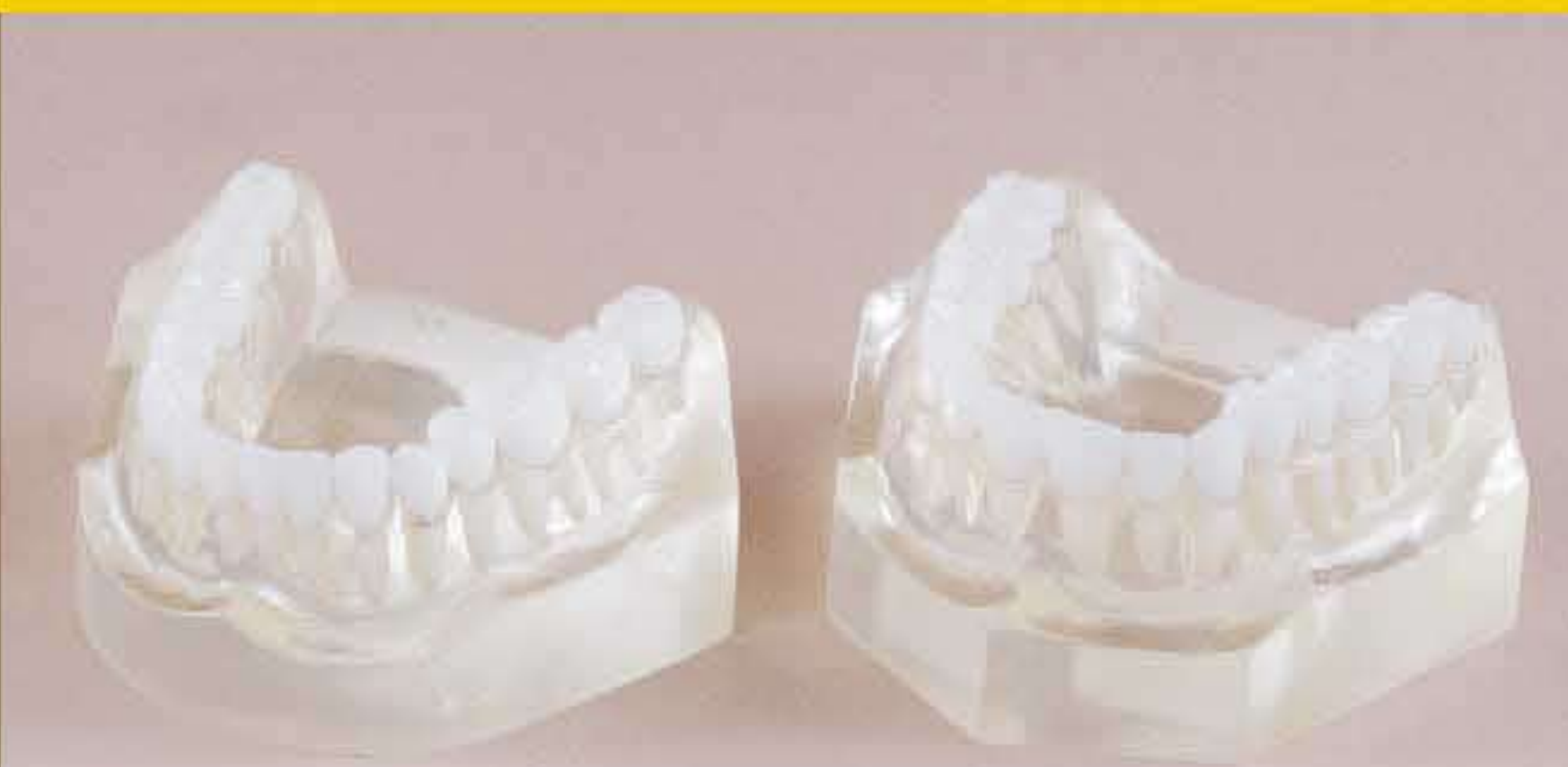
Fig. RV-010 DT.1210.00 Set of 2, upper and lower / Serie di 2 - superiore e inferiore