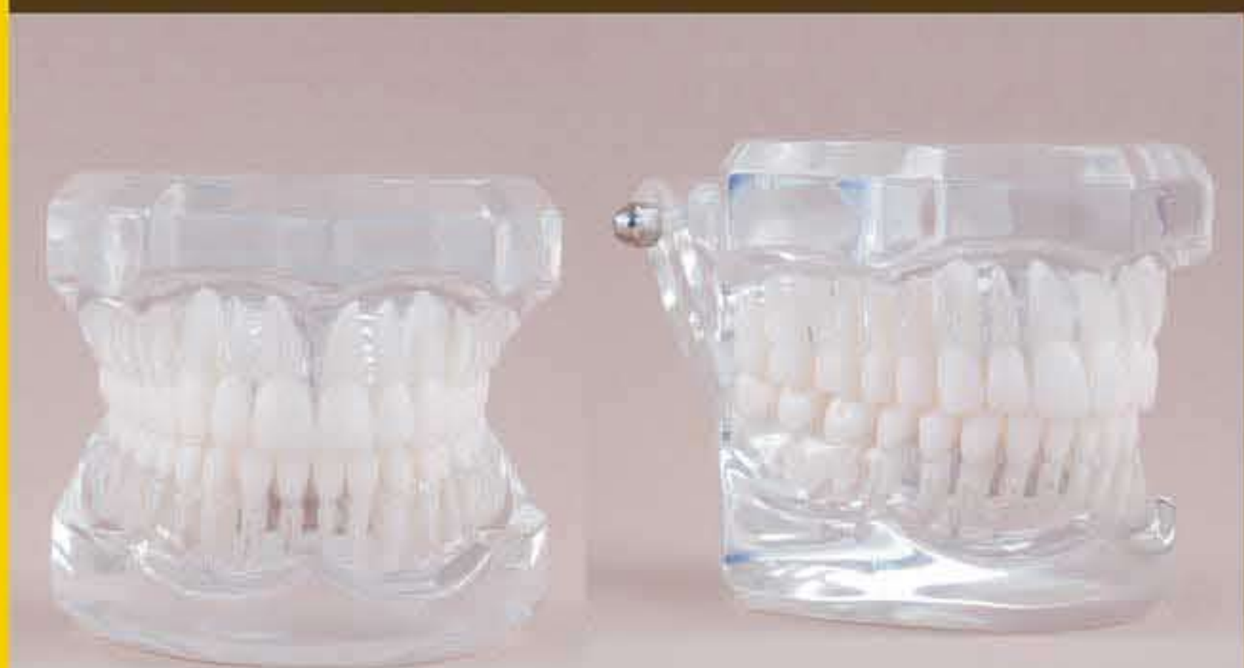
Fig. RE-110 DT.1250.00