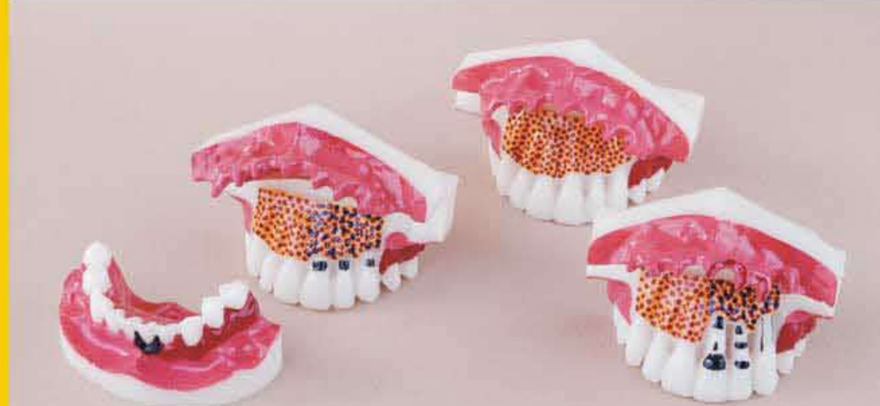
Fig. RV-004 DT.1225.00 Set of 4 models / Serie di 4 modelli

Serie di 4 modelli con varie patologie parodontali