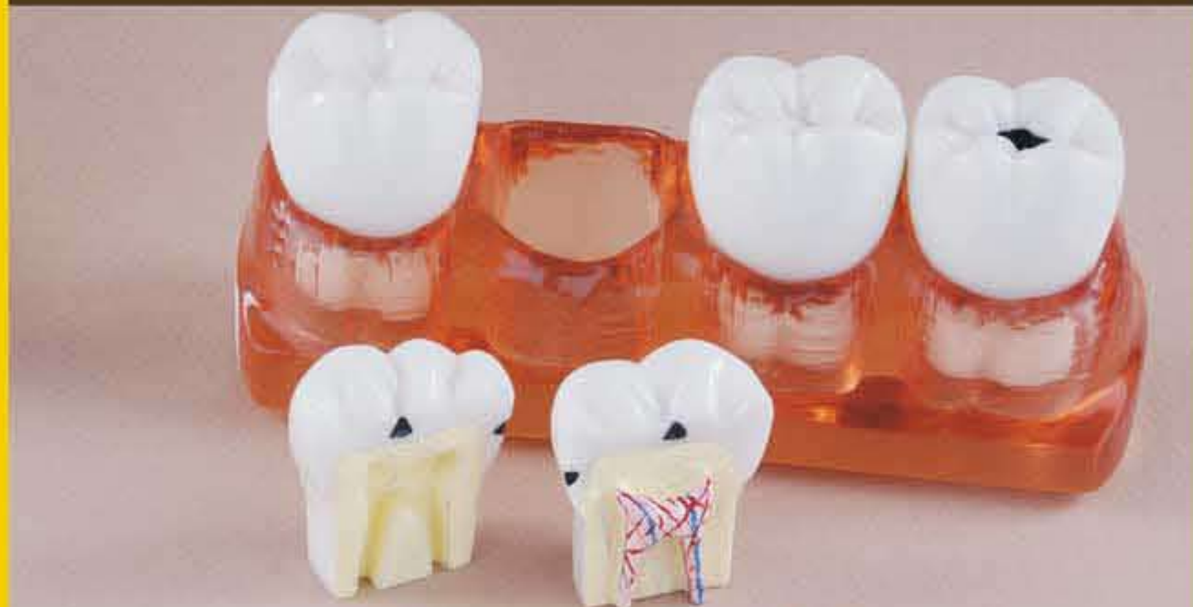
Fig. RV-003 DT.1220.00 Set of 4 teeth with holder / Serie di 4 denti con supporto

Serie di 4 denti con diverse carie dentali