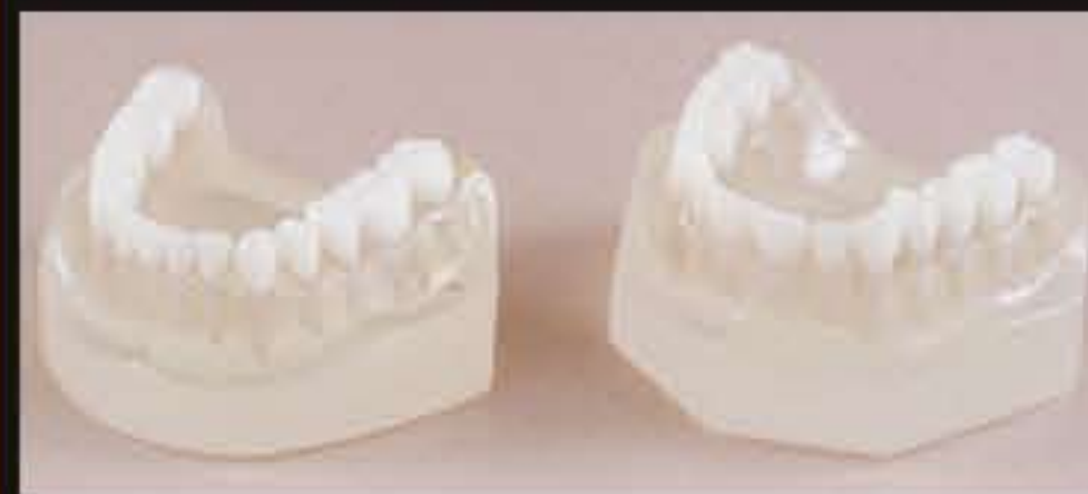
DT.1316.01 Teeth without roots Denti senza radici DT.1316.02 Teeth with roots Denti con radici