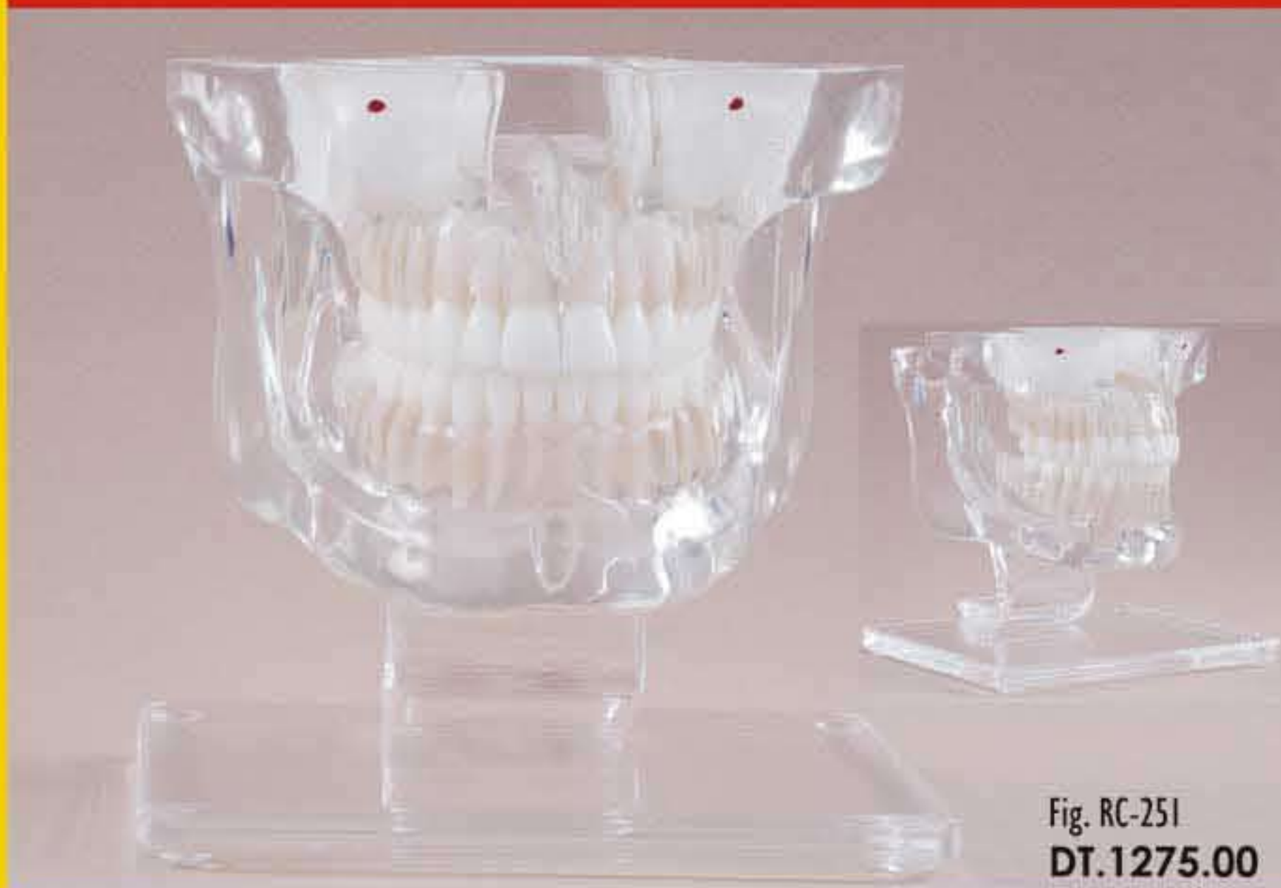
Fig. RC-251 DT.1275.00