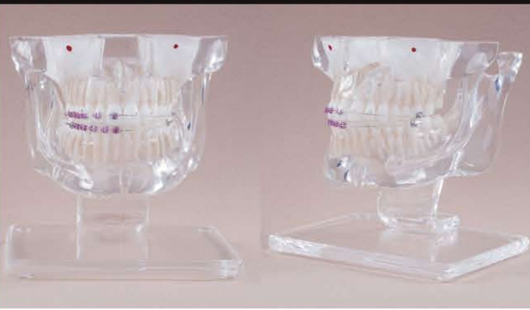
DT.1320.01 With metal brackets / Con brackets in metallo DT.1320.02 With ceramic and metal brackets / Con brackets in ceramica e metallo