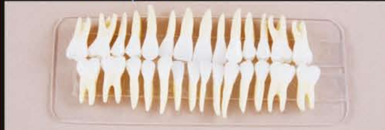
DT.1403.02 Set of 28 teeth without roots / Set di 28 denti senza radici DT.1403.03 Set of 28 teeth with roots / Set di 28 denti con radici