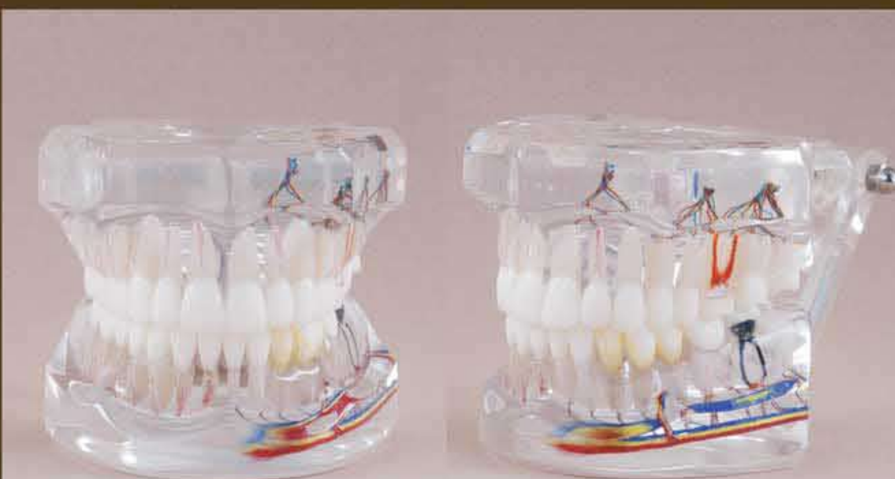
Fig. RE-111 DT.1251.00